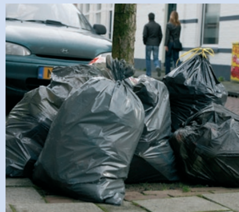
Binnenkort verleden tijd!

Als u vragen heeft over ondergrondse afvalcontainers, dan kunt u bellen met de servicelijn van de gemeente Zwolle, telefoonnummer (038) 498 33 00 of e-mail servicelijn@zwolle.nl . Ook kunt u uw vragen stellen aan de klantenservice van ROVA, telefoonnummer (038) 427 37 77 of e-mail info@rova.nl .